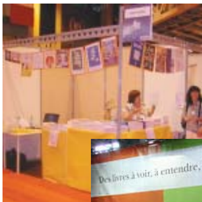
Stand au salon Autonomic, 2008, Paris