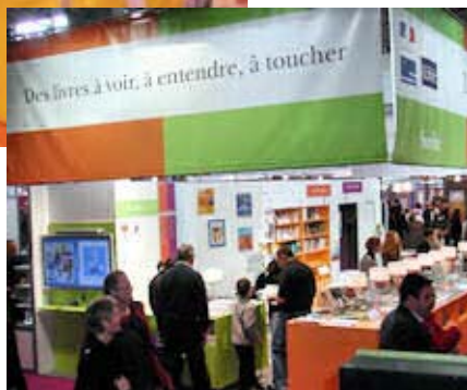
Salon du livre, sur le stand du ministère de la culture, Lecture adaptée, 2009 Paris