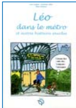
Édition hors commerce pour la RATP